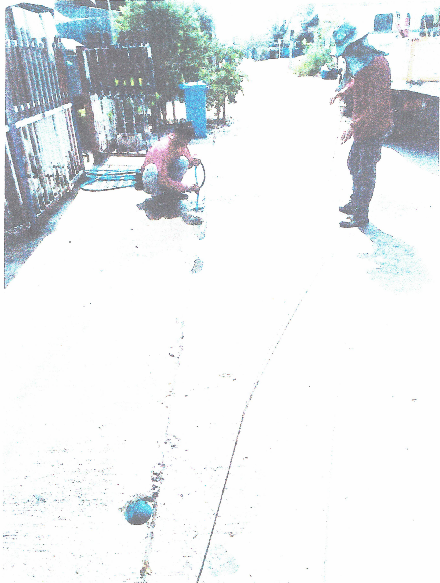
ภาพถ่ายขณะดำเนินการ